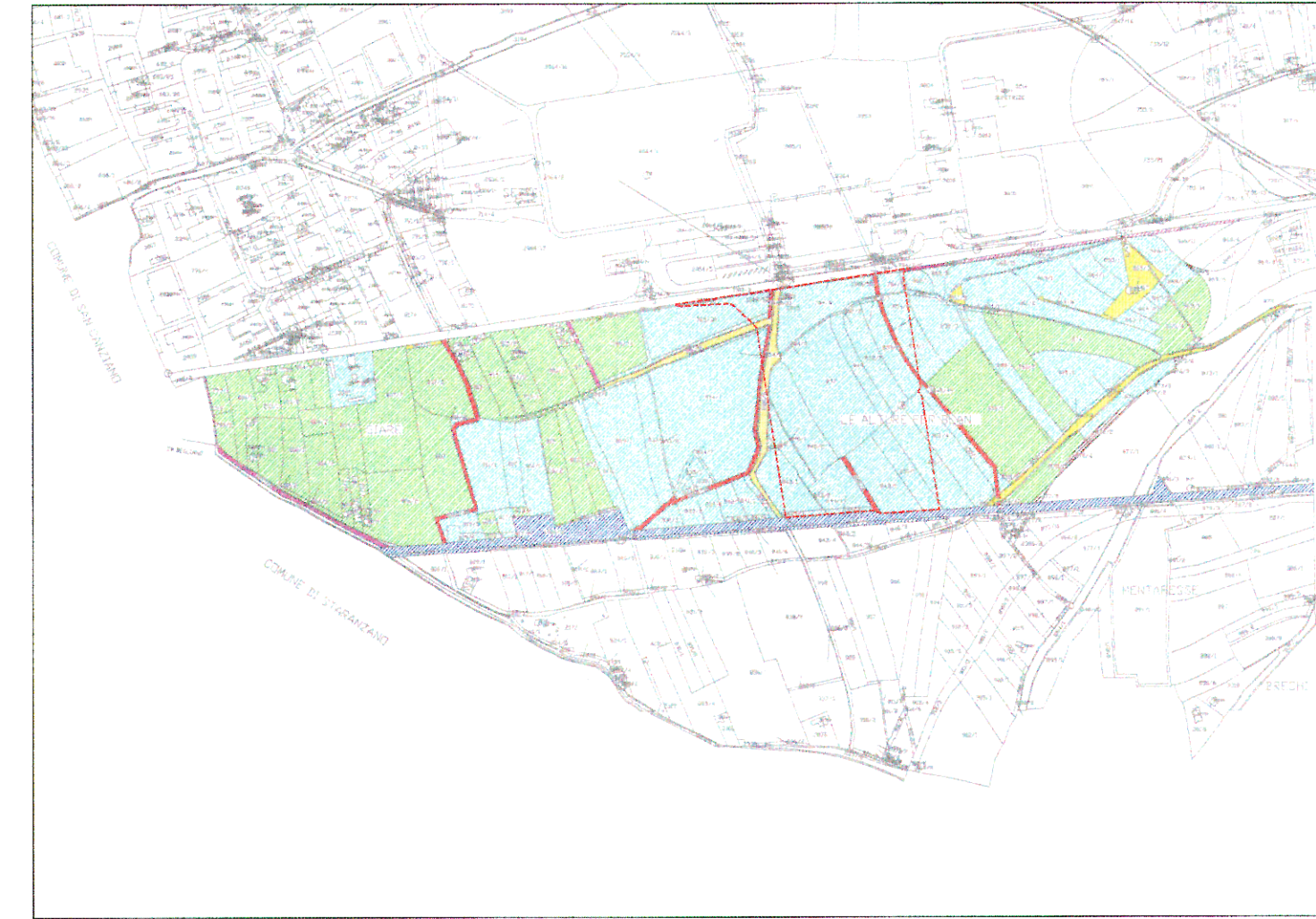
Mappa catastale_scala 1:10000