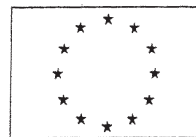
FONDO EUROPEO DI SVILUPPO REGIONALE